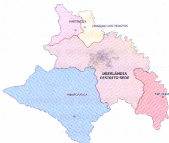
Distâncias dos distritos em relação à Sede

Ademais, a cobertura de Saúde Bucal em Equipe de Saúde da Família é de 20,2%, e na Atenção Básica é de 34,05%. Além disso, os Núcleos de Apoio à Saúde da Família somam 12 equipes.