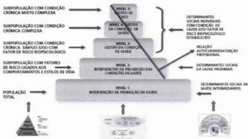
Figura 2 – Modelo de atenção das condições crônicas